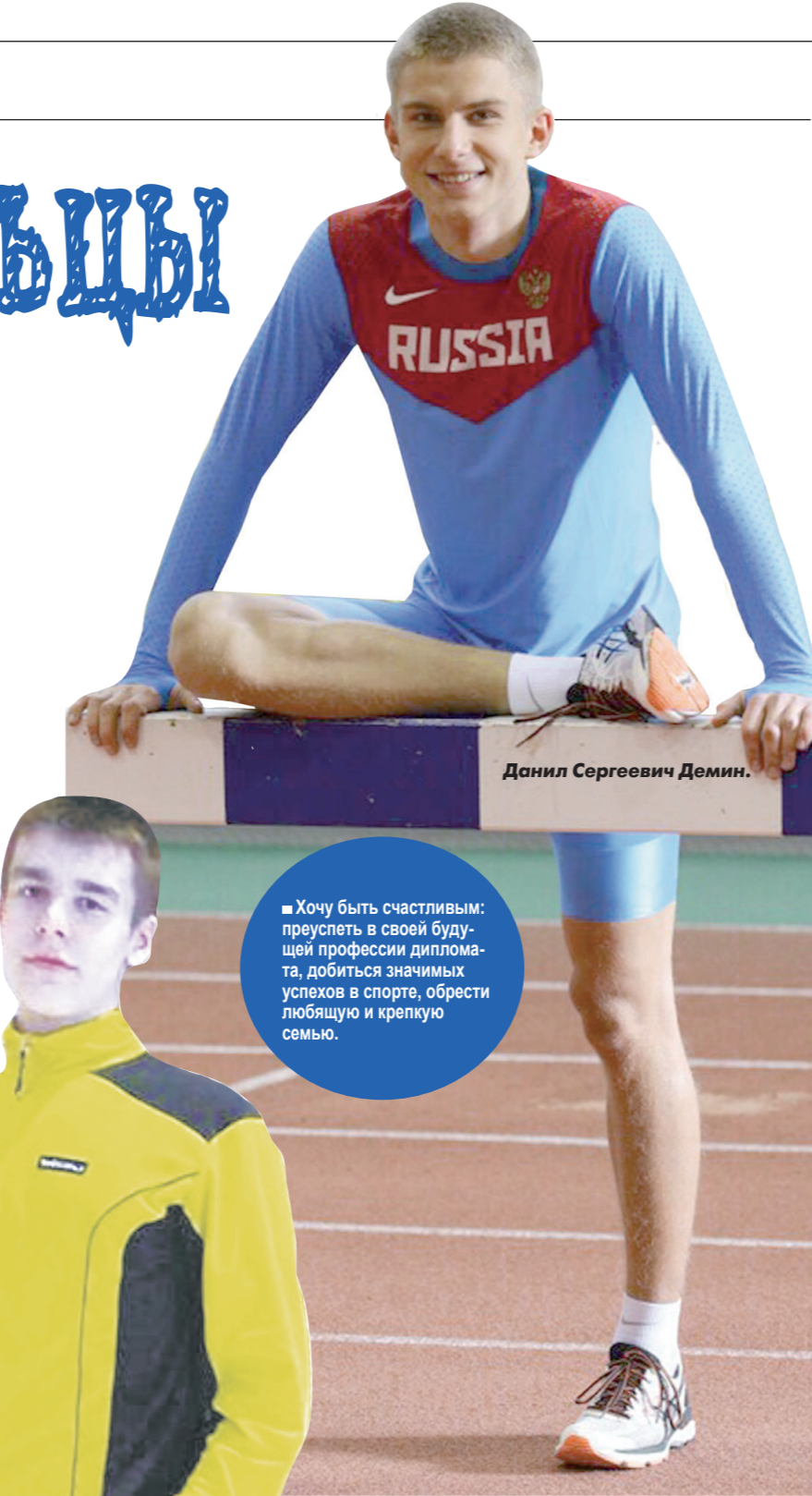
■ Хочу быть счастливым: преуспеть в своей будущей профессии дипломата, добиться значимых успехов в спорте, обрести любящую и крепкую семью.

Д.С.: Помнится, как однажды я приехал на зимнее первенство Москвы и по-